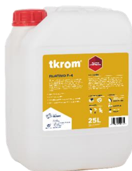
TKROM FIJATIVO F-4

Descripción del producto: Fijativo mural al agua, de base acrílica, adecuado para consolidar soportes murales de todo tipo, o capas de viejas pinturas caleadas, así como para barnizar ladrillos, piedra natural o artificial, etc. Posee una magnífica resistencia a la alcalinidad, siendo el soporte ideal de las sucesivas capas de pintura a aplicar sobre los soportes citados.