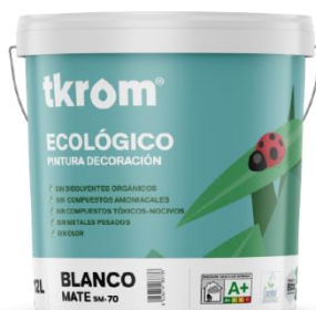
TKROM ECOLOGICO MATE SM-70

USOS/AMBITO DE APLICACIÓN: Producto ideal para la decoración y protección de: Interiores de viviendas, escuelas, hoteles, Residencias, Restaurantes, Oficinas, Locales públicos, Guarderías, Hospitales, etc. Permite utilizar los espacios pintados inmediatamente después de su aplicación y secado, sin olores ni vapores molestos. Se puede aplicar incluso en presencia de personas particularmente sensibles, como niños o ancianos.