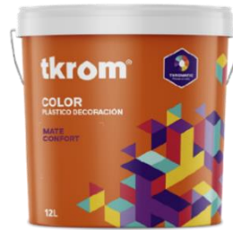
TKROM MATE CONFORT

Descripción del producto: Pintura Base Blanca a base de copolímeros vinil etilénicos. Producto integrado en el Sistema Colorimétrico TKROM COLOR, para el pintado de superficies murales en interiores, proporcionando acabados lisos y uniformes de gran belleza, altamente protectores por su gran resistencia a los soportes alcalino y a la humedad.