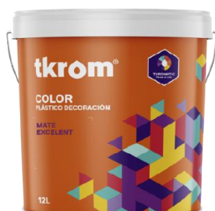
TKROM MATE EXCELENT

Descripción del producto: Bases Blanca a base de copolímeros vinil etilénicos. Producto integrado en el Sistema Colorimétrico TKROM COLOR, para el pintado de superficies murales tanto en interiores como en exteriores; proporcionando acabados lisos y uniformes de gran belleza, altamente protectores por su gran resistencia a los soportes alcalinos, a la humedad y a los agentes atmosféricos.