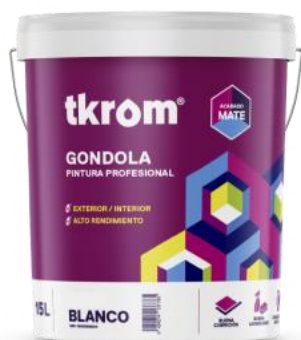
TKROM MATE GONDOLA

Descripción del producto: Pintura plástica mate a base de una dispersión acuosa de copolímeros acrílicos, de acabado mate-sedoso. Tiene excelente adherencia a los distintos materiales usados en la construcción, fácil aplicabilidad, buena opacidad, rendimiento y lavabilidad.