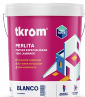
TKROM MATE PERLITA

Descripción del producto: Pintura plástica a base de emulsión de copolímeros acrílicos especialmente formulada para pintar yesos proyectados o laminados. Muy buena adherencia y penetración sobre yesos proyectados. Excelente blancura y opacidad, acabado mate profundo y gran facilidad de aplicación con muy buena nivelación.