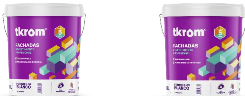
TKROM REVESTIMIENTO PETREO R52 y TKROM REVESTIMIENTO PETREO R53

Descripción del producto: Revestimiento liso para fachadas, a base de dispersión de copolímero acrílico. Impermeable, transpirable, con muy buena dureza y adherencia a los diferentes materiales utilizados en la construcción y gran resistencia a los agentes atmosféricos. Formulado y diseñado especialmente para uso profesional tanto en obra nueva como en rehabilitación.