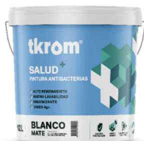
TKROM SALUD PLUS

Descripción del producto: Pintura plástica antibacterias, que gracias a su formulación con iones de plata (Ag+) actúa como escudo protector frente a la proliferación de bacterias en un 99,9%, inhibiendo sobre el film el crecimiento de microorganismo. Incorpora además la acción fungicida y posee buenas propiedades de limpieza, manteniendo de manera continuada su propiedad antibacterias. Transpirable, de fácil aplicación y con excelente acabado decorativo, siendo el producto ideal para el pintado de cualquier superficie.