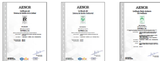
Figura 1: Certificados ISO 9001, ISO 14001 y Huella de Carbono de Organización.