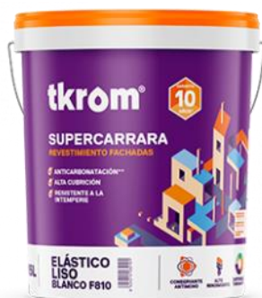
TKROM SUPERCARRARA ELASTICO LISO

Descripción del producto: Revestimiento plástico de gran elasticidad, fabricado a base de resinas acrílicas fotorreticulantes de máxima resistencia a los agentes atmosféricos. Posee la propiedad de deformarse siguiendo los movimientos de dilatación y contracción de las fachadas, sin romperse ni agrietarse. Al secar proporciona una película de gran espesor y elasticidad y máxima impermeabilidad. Debido a su reticulación por radiación ultravioleta, posee gran resistencia al ensuciamiento.