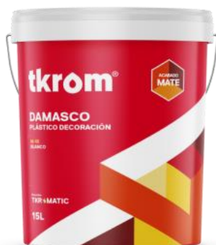
TKROM MATE DAMASCO

Descripción del producto: Pintura plástica mate a base de dispersión acuosa de copolímero acrílico. Formula mejorada, minimiza la salpicadura producida por el pintado a rodillo. Dirigida al sector profesional proporcionando acabados de alta calidad. Bajos niveles de COV'S y libre de amoniaco.