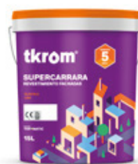
SUPERCARRARA LISO INFINITY 15L / 4L