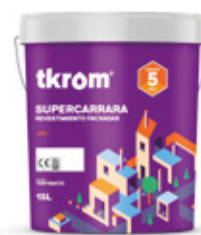
SUPERCARRARA ELÁSTICO LISO INFINITY 15L / 4L