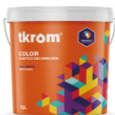
MATE EXCELLENT* INFINITY 15L / 4L