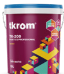
TK 200 INFINITY 15L / 4L